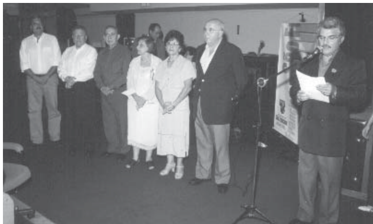
Entrega dos Diplomas aos Patronos da ARE - Academia Ribeirão-pretana de Educação

ódio à Morte e a paixão pela vida lhe valeram este suplício indescritível em que todo ser se ocupa em completar nada. É o preço a pagar pelas paixões deste mundo. Nada nos foi dito sobre Sísifo nos infernos. Os mitos são feitos para que a imaginação os anime. Neste caso vê-se apenas todo o esforço de um cor-